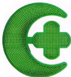
Luna (60x60 cm)

Estructura de acero inoxidable lacado con poliéster termodurecible Control de brillo automático Preprogramada